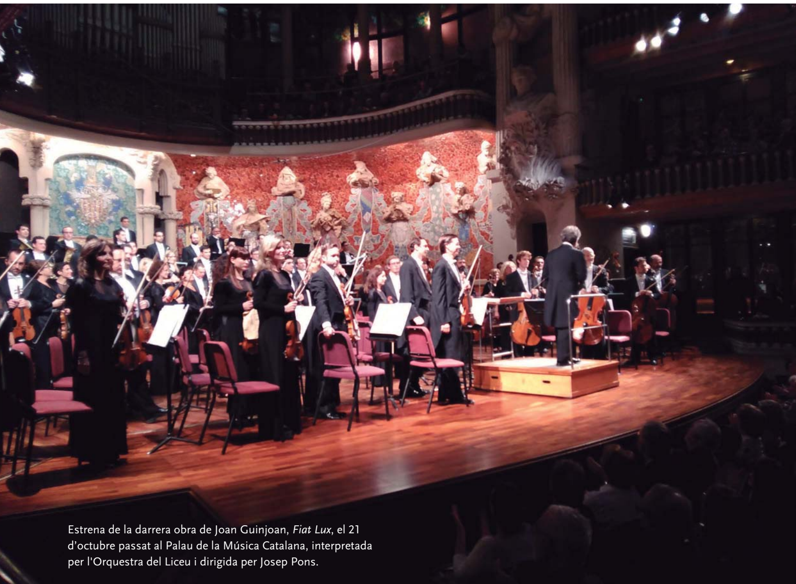
Estrena de la darrera obra de Joan Guinjoan, Fiat Lux , el 21 d'octubre passat al Palau de la Música Catalana, interpretada per l'Orquestra del Liceu i dirigida per Josep Pons.

Tenint en compte el context del públic, va ser una sorpresa molt agradable per a mi perquè potser mai de la vida no havia tingut una estrena amb un públic tan tradicional i